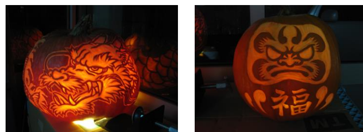
昨年の最優秀賞作品