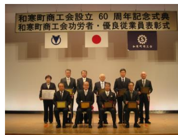
60周年記念表彰受賞者