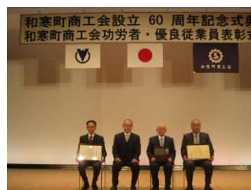
功労者・優良従業員表彰受賞者

※商工会設立60周年記念にあたり、会員皆様へ記念誌と記念品を同封いたしましたので、お受け取りください。